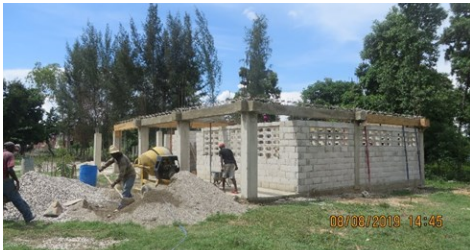
Travaux du deuxième bâtiment. Actuellement 2 classes supplémentaires vont être fonctionnelles.

Plusieurs classes de notre CCA sont présentement logées dans des locaux petits et temporaires... alors qu'un ensemble de 13 bâtiments est prévu... en fonction des ressources.